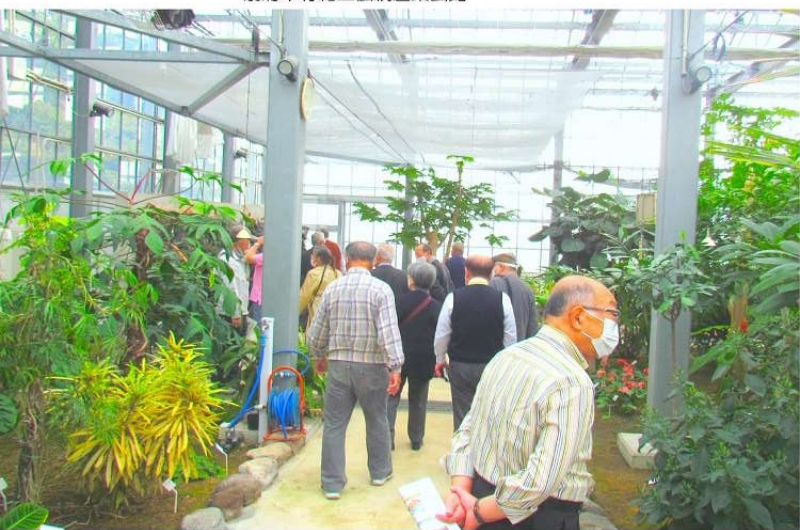
大分県花き研究センター（蒸気発電施設）