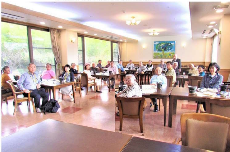
明礬温泉 昼食 「さわやかハートビ7明礬」