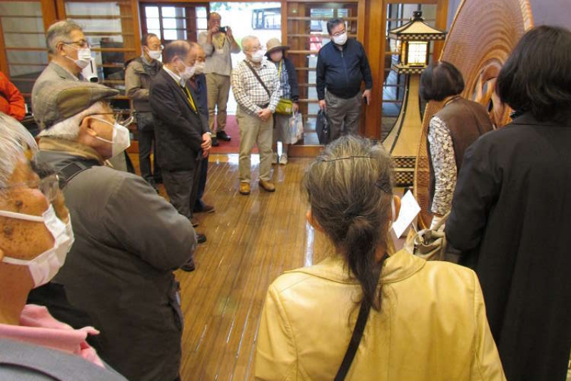
別府市竹細工伝統産業会館